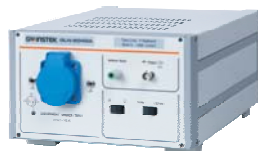
GLN-5040A 線性阻抗穩定網路