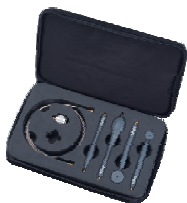
GKT-008 EMI 近場測棒組