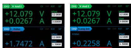
脈波電流量測畫面 Long Integration量測畫面